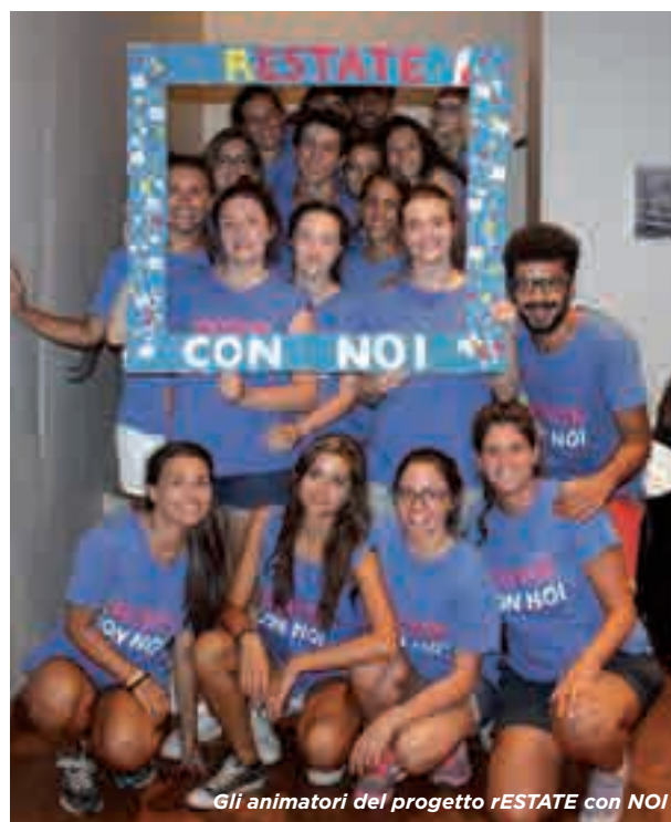
Gli animatori del progetto rESTATE con NOI

Un enorme riscontro per la buona riuscita della colonia, lo abbiamo avuto nella serata conclusiva, organizzata con pizza e film a teatro, alla quale hanno partecipato con grande entusiasmo più di 80 bambini. Alla fine di settembre alle fa-