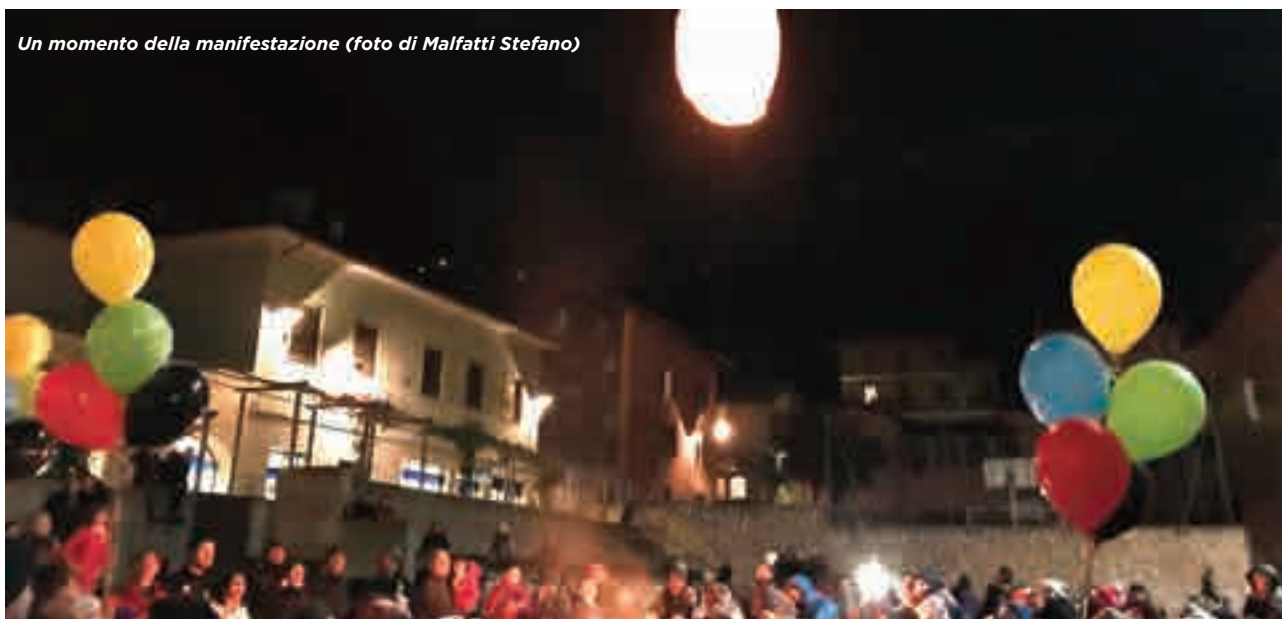
Un momento della manifestazione