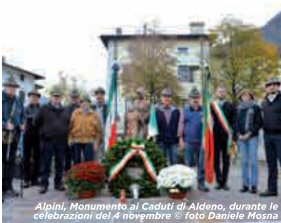
Alpini, Monumento ai Caduti di Aldeno, durante le celebrazioni del 4 novembre

do a comunicare poco tra loro. Un dato di fatto, questo, molto triste nella realtà di oggi. Quindi potete passare al circolo, ad esempio per proporre dei tornei o delle gite in montagna o altre cose. Il Direttivo terrà presente le vostre proposte, per poi valutarne l'eventuale e possibile realizzazione. Il Direttivo ringrazia tutti i volontari e gli Alpini che sono presenti alle manifestazioni come la Befana, il Carnevale e la Festa Alpina, nata due anni fa. In queste occasioni c'è bisogno di un numero elevato di persone per poterle realizzare nel modo migliore per tutti. Un Grazie di Cuore. La Direzione vi augura un Buon 2019 e ricorda il rinnovo del tesseramento per l'anno 2019 agli Alpini, ma rivolge anche un invito al tesseramento 2019 ai simpatizzanti Alpini. Grazie a voi potrà proseguire quello che i nostri nonni hanno costruito per Noi... Una comunità viva e umana di persone che si aiutano tra di loro.