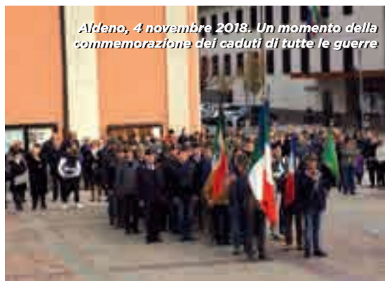
Aldeno, 4 novembre 2018. Un momento della commemorazione dei caduti di tutte le guerre