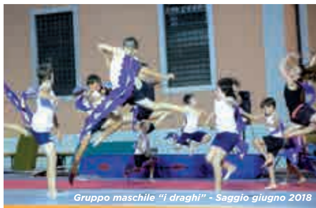
Gruppo maschile "i draghi" - Saggio giugno 2018