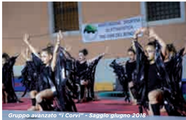
Gruppo avanzato "i Corvi" - Saggio giugno 2018

Dopo un primo anno di rodaggio è stato deciso, di concerto