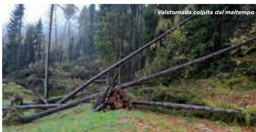
Valstornada colpita dal maltempo

rossi e 30 larici). La strada forestale è stata prontamente liberata dal Servizio Foreste e Fauna, che si ringrazia vivamente.