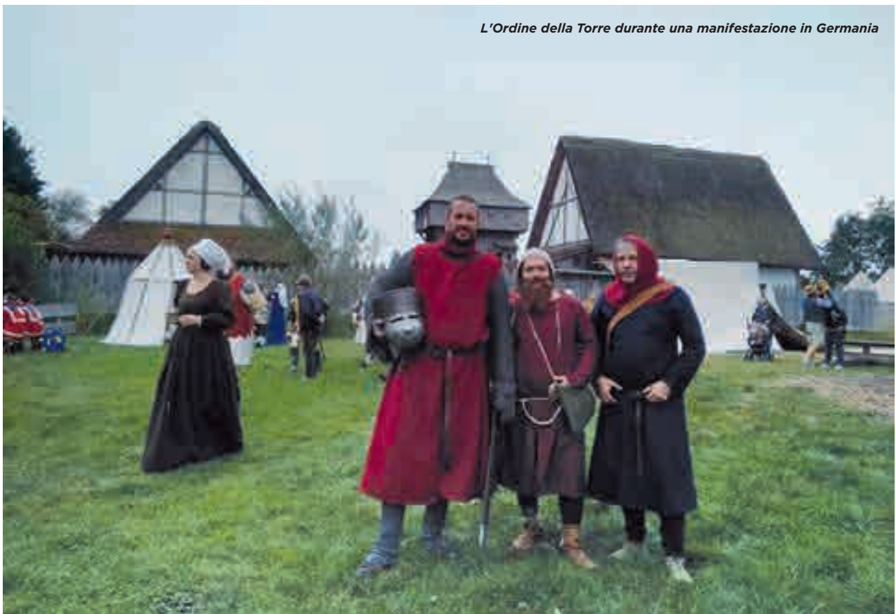
L'Ordine della Torre durante una manifestazione in Germania

Per chi invece fosse interessato a quello che facciamo, ricordo che siamo un gruppo aperto a chiunque volesse partecipare. Per farlo contattatemi al 340-7114621 o per email: ordinedellatorre@gmail.com .