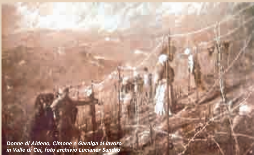
Donne di Aldeno, Cimone e Garniga al lavoro in Valle di Cei, foto archivio Lucianer Sandro

duzione generale alla vita economica, politica e culturale in Trentino e in particolar modo ad Aldeno tra l'Ottocento e il Novecento. In questo scorcio pre-bellico vi era una fiorente crescita data dalla bonifica dei territori, che portò ad un aumento demografico e a migliori condizioni sanitarie. Le attività in paese erano molto floride e vi fu un significativo sviluppo urbanistico (è proprio in questo periodo che vennero costruiti gli edifici delle ormai ex scuole elementari e dell'odierno comune con annesso il teatro).