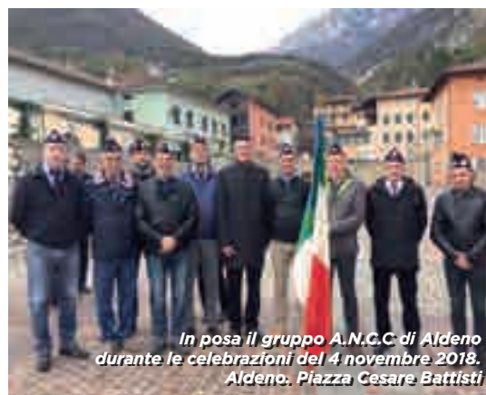
In posa il gruppo A.N.C.C. di Aldeno durante le celebrazioni del 4 novembre 2018. Aldeno. Piazza Cesare Battisti

Nello scorso mese di novembre, in veste di A.N.C. (Associazione Nazionale Carabinieri), abbiamo partecipato alla Commemorazione dei Caduti di tutte le guerre e alla ricorrenza della Virgo Fidelis patrona dell'Arma dei Carabinieri.