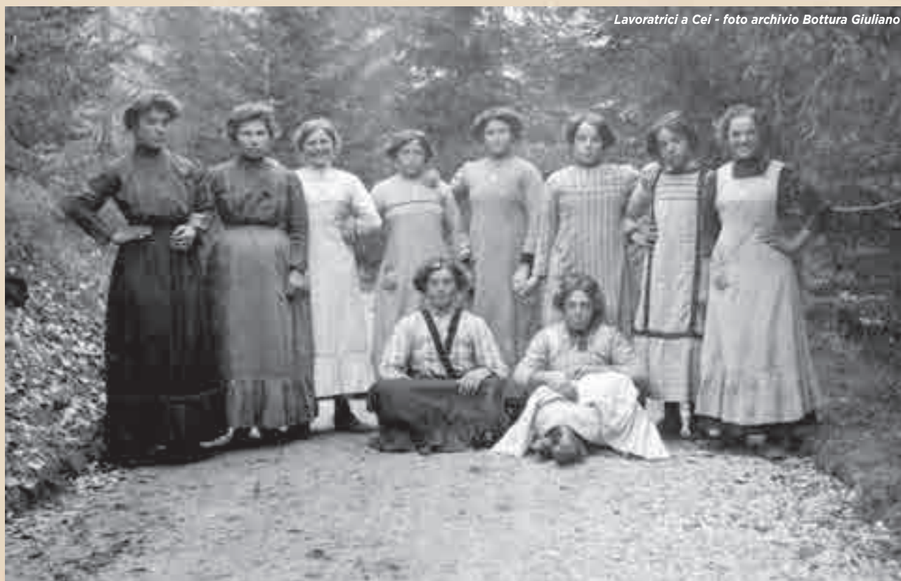
Lavoratrici a Cei

Italiano della Guerra. In questi luoghi, spesso dipinti come chiusi e polverosi, abbiamo raccolto una serie di documenti davvero interessanti come, per esempio, la lista delle donne che, in assenza degli uomini, entrarono a far parte del corpo dei Vigili del Fuoco, o gli avvisi sulle norme comportamentali in caso di attacchi aerei. Documenti che riassumono, come quelli prodotti, in tempo di guerra, dall'esercito italiano, uno spaccato di vita quotidiana in una situazione così straordinaria. Dopo aver messo assieme tutti i pezzi, ci siamo dedicati alla stesura, volendo fornire nel primo capitolo un'intro-