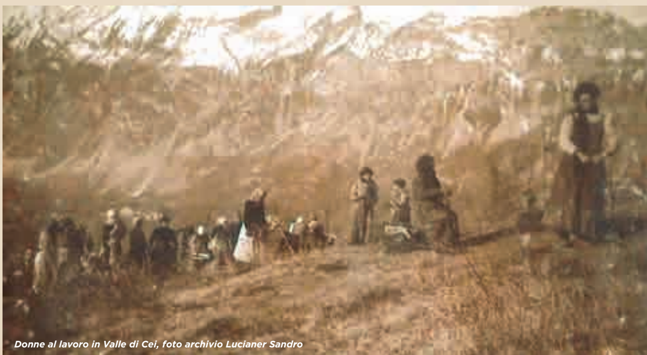
Donne al lavoro in Valle di Cei