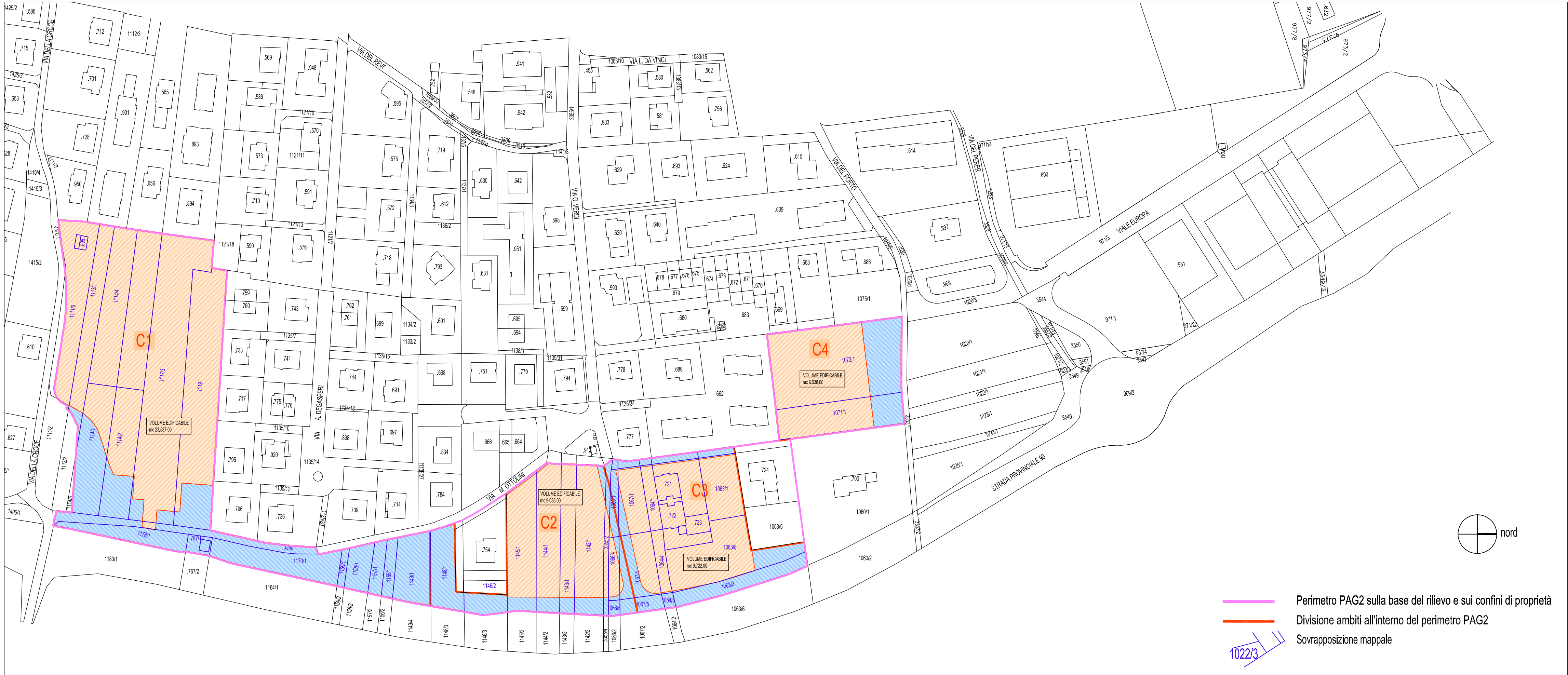
PLANIMETRIA GENERALE scala 1 : 1 000