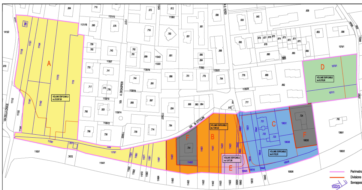
PLANIMETRIA PIANO GUIDA VIGENTE TAVOLA 2 - AMBITI A-B-C-D-E-F

Anche la rappresentazione cartografica degli ambiti viene conseguentemente modificata nella seguente maniera: