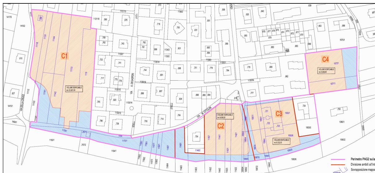
PLANIMETRIA PAG 2 VIGENTE - COMPARTI C1-C2-C3-C4 E AREE A DESTINAZIONE PUBBLICA

Il PAG 2 ha stabilito che ogni comparto può autonomamente decidere se procedere con l'attribuzione della proprietà suddivisa in millesimi creando un'unica particella o se sviluppare la suddivisione in singoli lotti edificabili: in tal senso il piano attuativo ha attribuito a ciascun lottizzante una "collocazione funzionale condivisa" nell'ambito della tavola planivolumetrica, definendo le tipologie edilizie, la posizione e la dimensione orientativa dei futuri edifici, pur prevedendo una certa flessibilità che solo l'attivazione dei singoli piani di lottizzazione, potrà dettagliare e affinare.