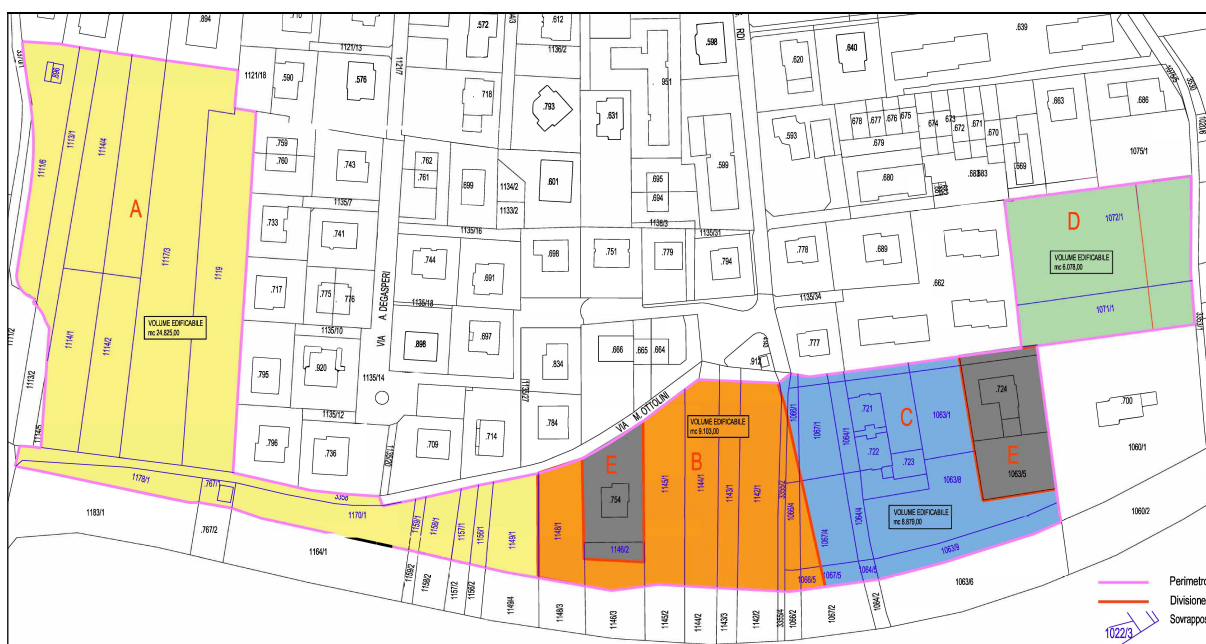
PLANIMETRIA VARIANTE 2023 AL PIANO GUIDA TAVOLA 4 - AMBITI A-B-C-D-E

Nel dettaglio la nuova ripartizione delle superfici e delle volumetrie nei 5 ambiti A-B-C-D-E stabiliti dalla presente Variante 2023 al piano guida nonché la distribuzione del volume edificabile per ciascuna proprietà, sono sintetizzati nella tabella seguente che mette in evidenza (colore blu) anche eventuali trasferimenti di superfici e quindi di volumetria tra ambiti: